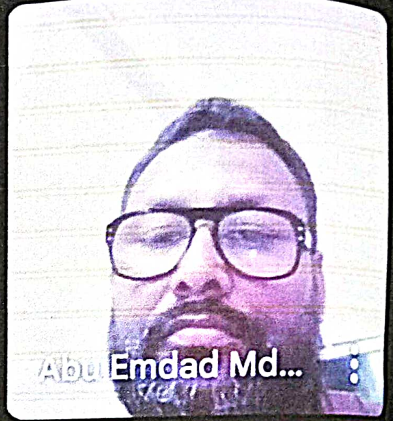
Abu Emdad Md...